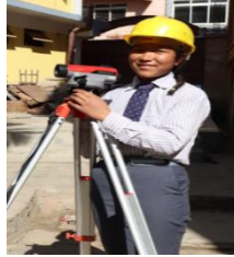
सिभिल इन्जिनियरिङ (building construction)